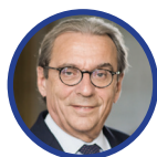
Roland Ries Président de Cités Unies France Maire de Strasbourg

Je vous engage d'ores-et-déjà à être des acteurs de cette 11 e édition des Rencontres de l'action internationale des collectivités territoriales : nous nous réjouissons de vous y retrouver !