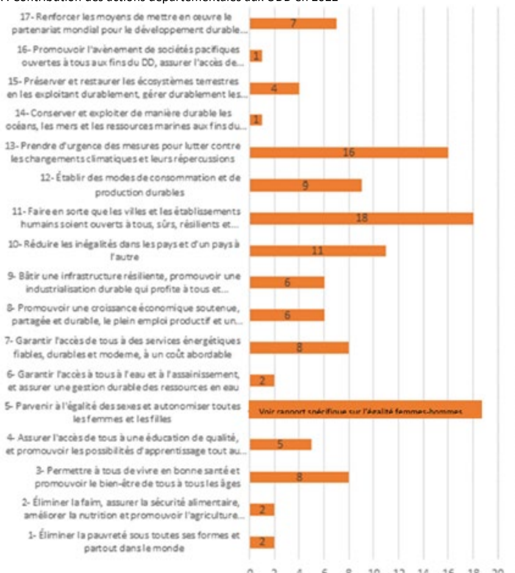
Figure X : Contribution des actions départementales aux ODD en 2022

Source : L'indicateur proposé dans ce graphique correspond à la somme des effets positifs des actions présentées dans les fiches bilan pour chaque ODD dans le RDD. CD Lot et Garonne, Situation en matière de Développement Durable 2022, Rapport annuel , p.33