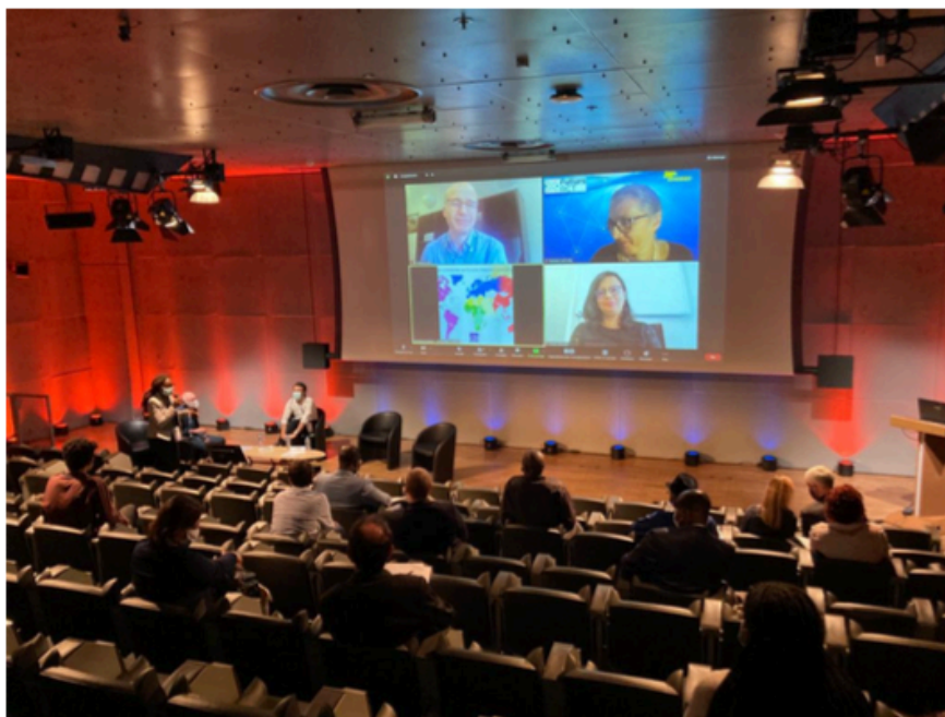
Photo de la salle, des intervenantes et intervenants

Résumé des RAICT sur notre site : https://cites-unies-france.org/-Rencontres-de-l-AICT-