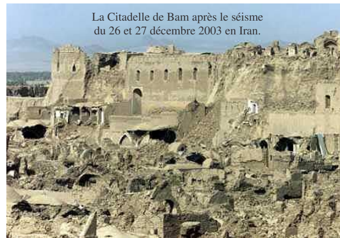
La Citadelle de Bam après le séisme du 26 et 27 décembre 2003 en Iran.

Siège de l'Association : c/o ENGREF - 19 avenue du Maine, 75015 Paris.