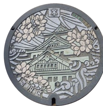
gonfler, dégonfler

Du 10 septembre au 13 octobre, Cosmopolis