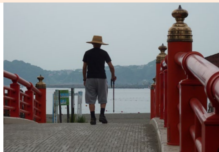
Les équinoxiales