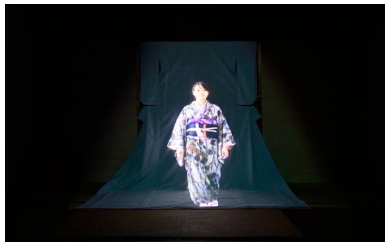
Ugetsu 2009 © Takenori Miyamoto et Hiromi Seno