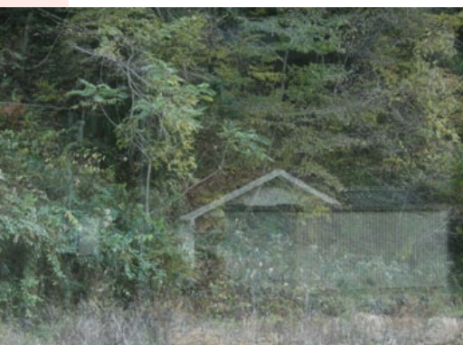
Genius Loci © Zoé Schellenbaum