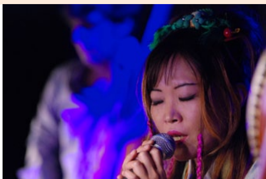
Oyuki la vierge © Alexia Villard