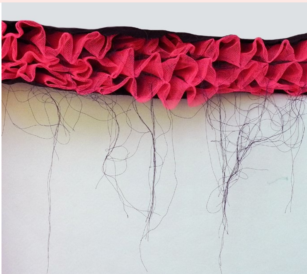
gonfler, dégonfler