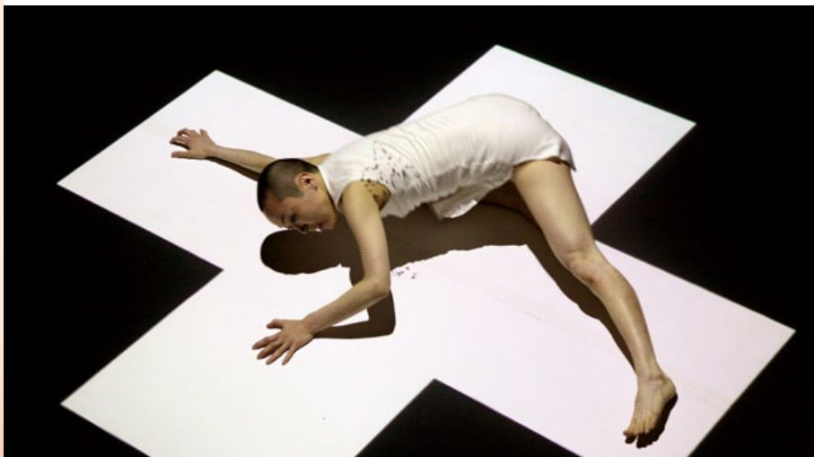
Loss © Irwin Leullier