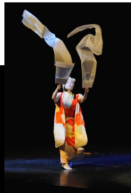
Yuko Fujima