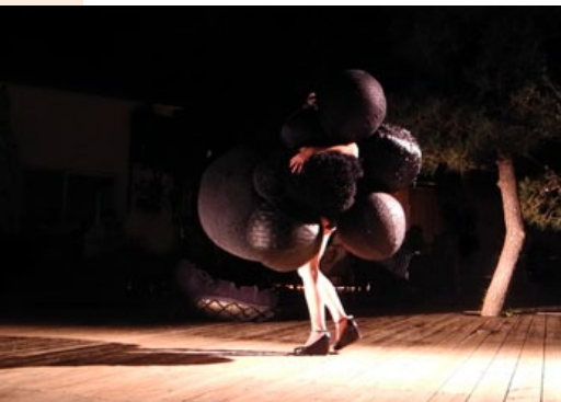
La première valise, performance © Baptiste Sorin