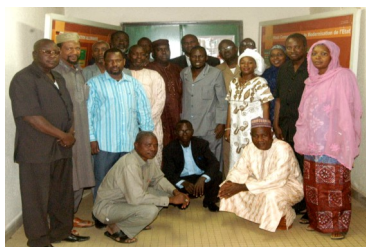
Le Comité est composé de représentants du HCME, de la Primature,

Depuis mars 2011, le Comité technique, créé par arrêté, chargé d'élaborer la PNME a tenu trois sessions. Innovation en termes de leadership et d'appropriation du Gouvernement, le Comité n'a pas fait appel à des consultants pour élaborer la politique.